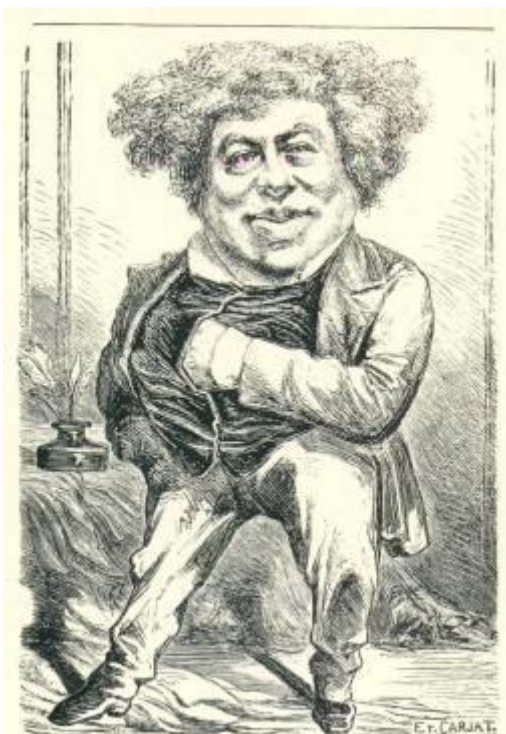
ETIENNE CARJAT'S IDEA OF DUMAS The novelist was always excellent game for caricaturists

La vanidad de Alejandro Dumas padre era tan enorme que llegó a serle perdonada al aceptarla